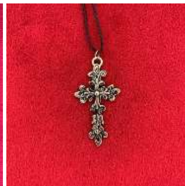
Croix en pendentif 8€