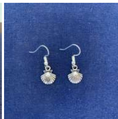
Les boucles d'oreilles coquille St Jacques 10€