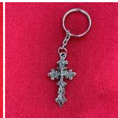
Croix en porte-clés 8€