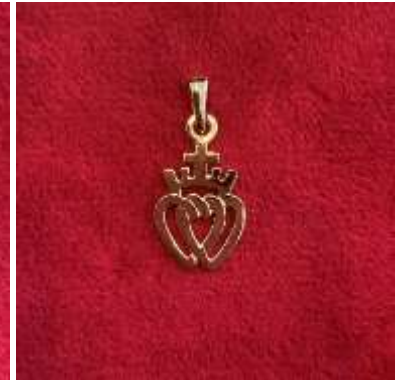
Le pendentif double cœur vendéen - grand