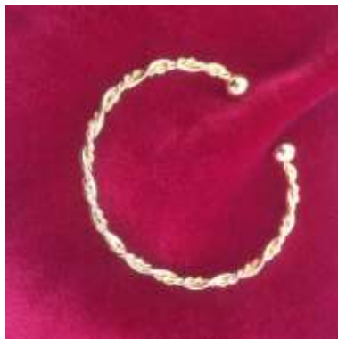
Bracelet torsadé doré ou argenté