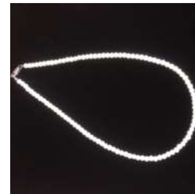
Collier de perles