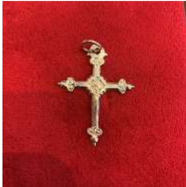
La croix Jeannette – petite