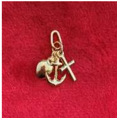
Le pendentif trois vertus