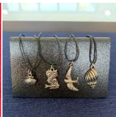
Pendentifs Histoire Naturelle coquille St Jacques / chouette / hirondelle / coquillage 5€ l'un