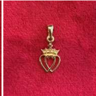
Le pendentif double cœur vendéen - petit