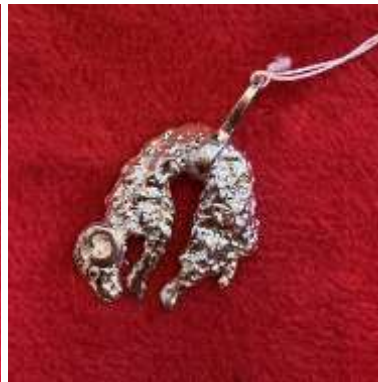
Le pendentif toison d'or