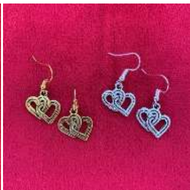
Les boucles d'oreilles cœurs dorées ou argentées 10€