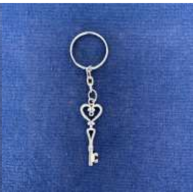
Porte-clés clé cœur