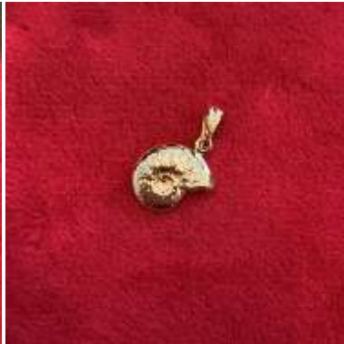
Le pendentif ammonite