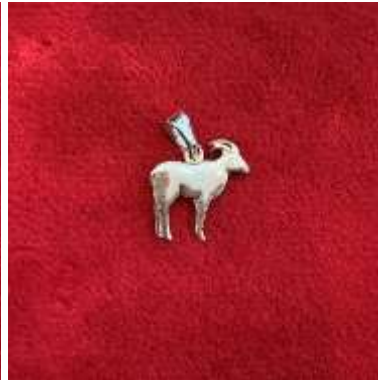
Le pendentif chamois