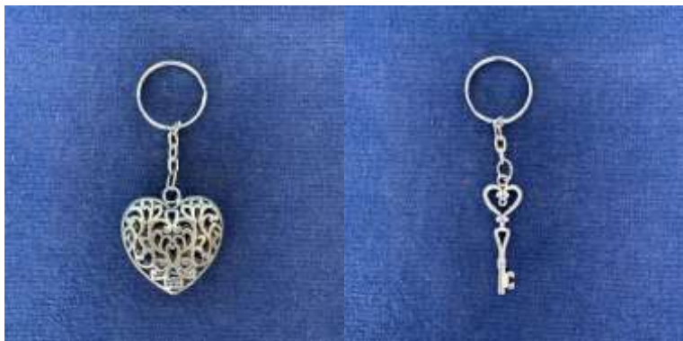
Porte-clés gros cœur