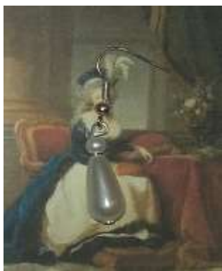
Boucles d'oreilles en perles