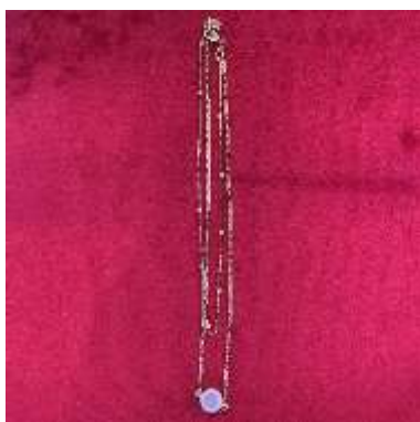
Collier de princesse 15€