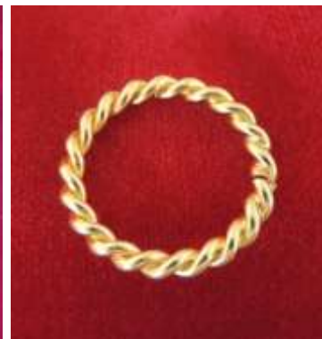
Bague torsadée dorée ou argentée