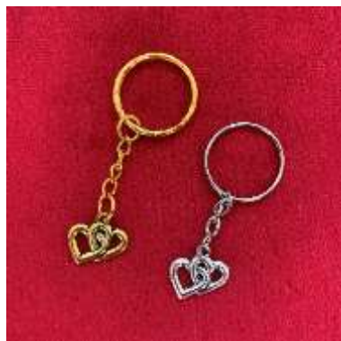
Cœurs en porte-clés dorés ou argentés 5€