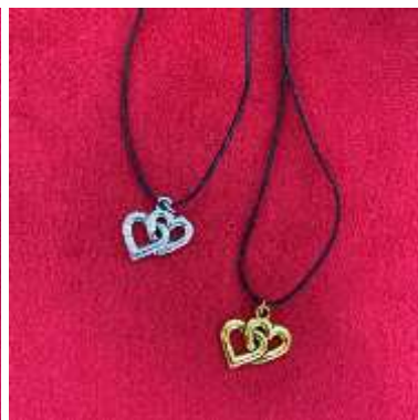
Cœurs en pendentifs dorés ou argentés 5€