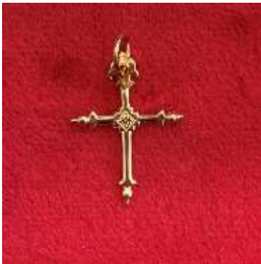
La croix Jeannette – grande