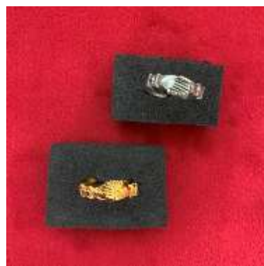
La bague mains dorée ou argentée 5€