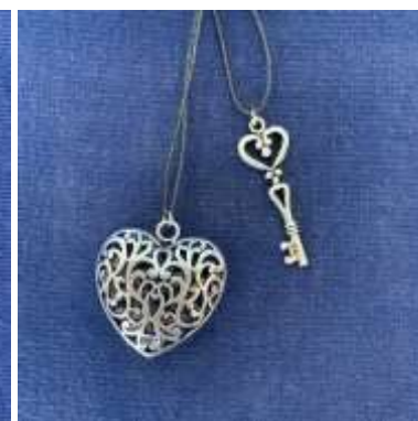
Pendentifs Clé cœur ou gros cœur 8€ l'un