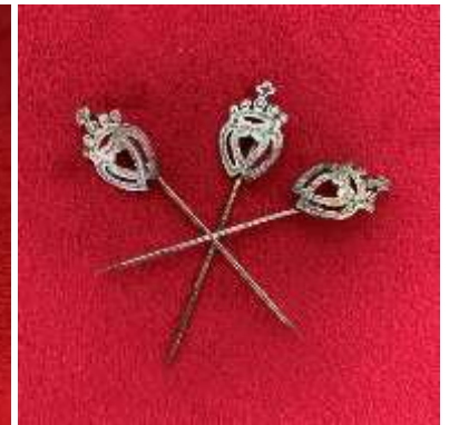
L'épingle cœur vendéen