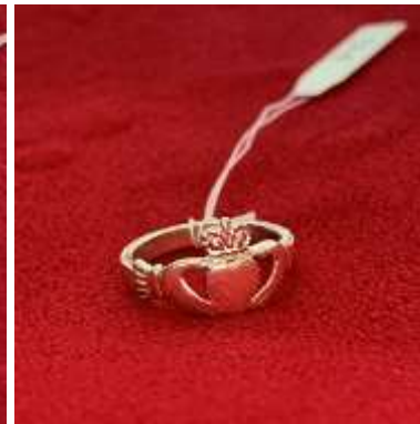
La bague de foi Taille : 52 / 54 / 56